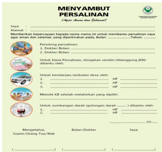
Gambar 2 : lembar Menyambut persalinan (19) (Buku Petunjuk Teknis pengisian buku KIA)

Pengisian amanat persalinan harus terisi lengkap dan diharapkan sudah selesai pada kunjungan K4 kehamilan.